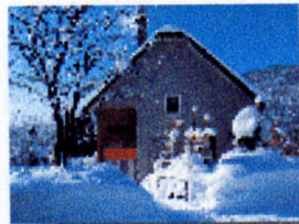
Mada in Asahikawa