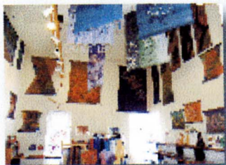
Textile Arts & Crafts SOUSOU